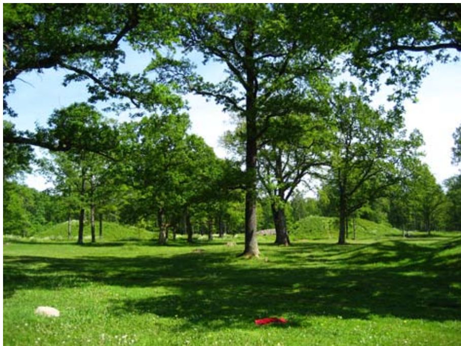
Fig. 1. Borregravfeltet i dag.

sin tilstedeværelse skulle endre framtiden. Haugene har stått og står fremdeles sentralt i diskusjoner om rikssamling, myter, historieskriving og forståelsen av både jernalderen og overgangen til kristendommen. Den posisjonen Borre inntar som Nordens største samling med storhauger gjør stedet sentralt, men samtidig kommer man ikke fram til noen endelige svar. Haugene på Borre vil fremdeles fremtvinge nye diskusjoner og være et referansemateriale som man forholder seg til. Hver generasjon skriver sin egen historie og Borres rolle vil også i fremtiden være med å generere ny kunnskap om vikingtidens fortid og framtid. Likevel har det helt frem til i dag vært noen autoritative verk som har stått sentralt i den offentlige og kollektive forståelsen av Borre. Med dette utgangspunktet vil vi presentere hvilke forståelser av Borre som har blitt formidlet og diskutere teoretiske aspekter ved fortidens bruk og formidling av fortiden til forskjellige formål i nåtiden. Hva kan man lære av fortiden, og hva kan man lære av hvordan fortiden tidligere har blitt forstått og formidlet?