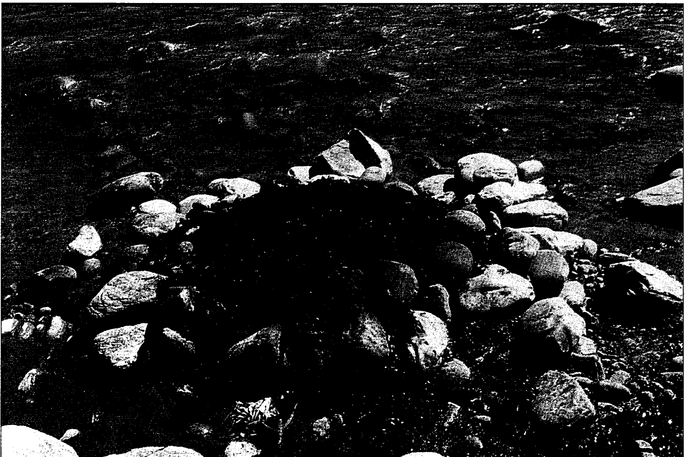
De materielle etterlevningene etter en kremasjon ved den hellige elven Kaligandaki Khola i Baglung distrikt, Nepal.

Popper tok utgangspunkt i naturvitenskapen, og som et overordnet rammeverk for hvordan vitenskap utføres, kan hans tilnæringsmåte også brukes innen arkeologien, enten man snakker om teorier,