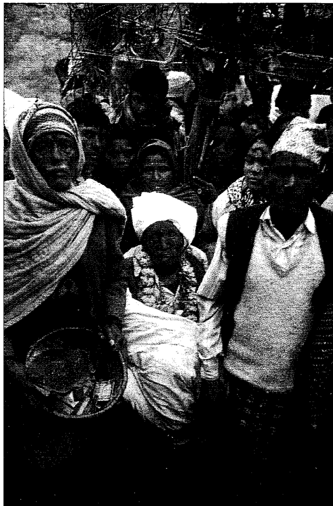
På den 1000. fullmånen i sitt liv (84 år) blir nepalesere (hinduister) feiret som levende forfedre. Feiringen blir holdt i hjemmet til den enkelte, og så mange som mulig fra landsbyen (og de omliggende landsbyene) er med på feiringen, uavhengig av kaste eller etnisk gruppe. Bildet viser feiringen av en kami (smed) ved fullmånen 23. januar 1997 i landsbyen Bhuskat i Baglung distrikt i Nepal.

Konsekvensen av dette har derimot blitt at man sjelden diskuterer analogibruken i det hele tatt. En tolkning som dette er et høvdingdømmesamfunn er ikke like innlysende som dette er en pil .