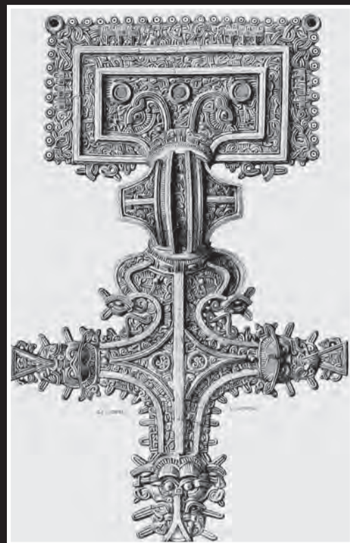
SPARBU: Dyrestil. Rygh 259a (C 4816) Dalem i Sparbu, Nord-Trøndelag.