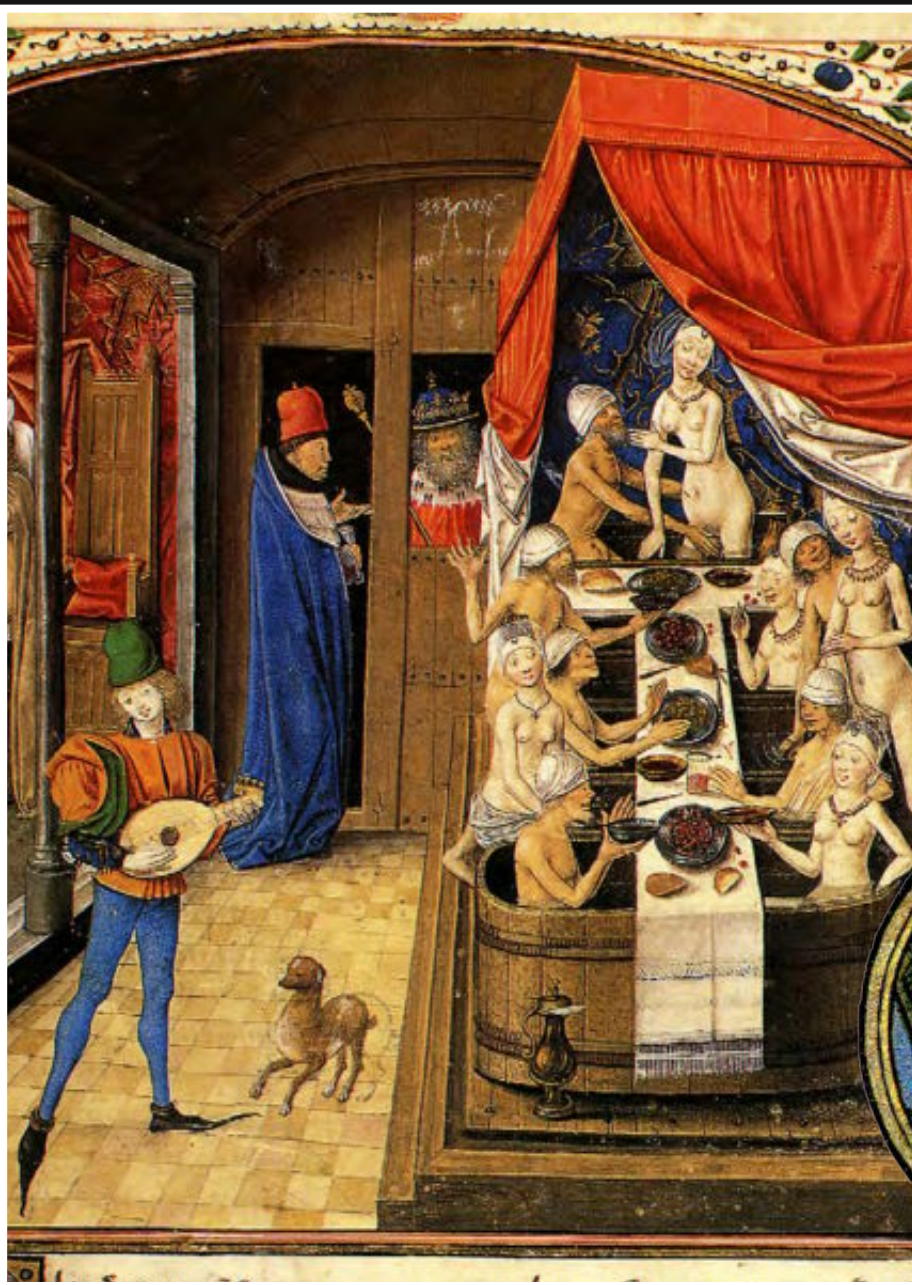
MIDDELALDEREN: Offentlig bad i middelalderen hvor menn og kvinner forlystet seg med bading, mat og vin.