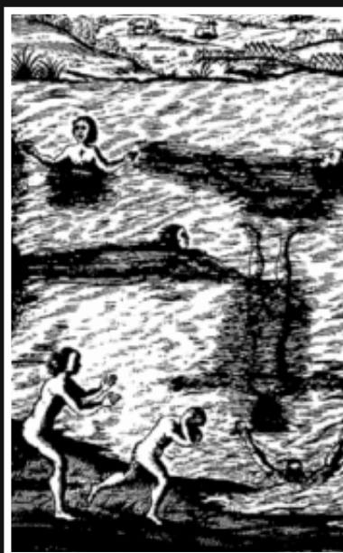
SVØMMEBOK: Forsiden til Perceys The Compleat Swimmer fra 1658.