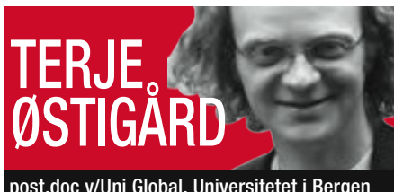
post.doc v/Uni Global, Universitetet i Bergen

Nå som badesesongen snart står for døren og man stuper ut i vannet, så er det en fritidsaktivitet som er et resultat av endrete forståelser av naturen og farer. Og i dag er en varm dusj på morgenen hygiene og ikke en syndig aktivitet, som kan ha noe å gjøre med hva som normalt foregår i dusjen.