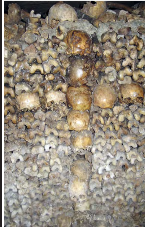
MAKABERT: Hodeskalledekorasjon i en «romantisk-makaber»-tradisjon.