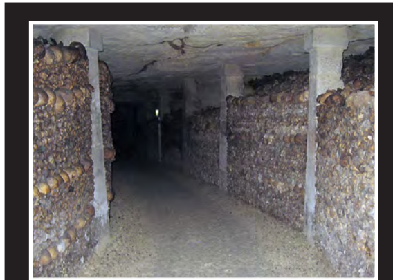
KATAKOMBENE: En labyrint av ganger med skjeletter.

post.doc v/Unifob Global, Universitetet i Bergen