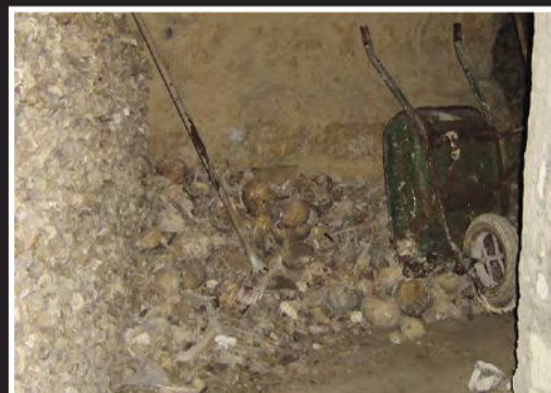
MUSEUMSARBEID: Å jobbe i katakombene medfører uvanlige arbeidsoppgaver.