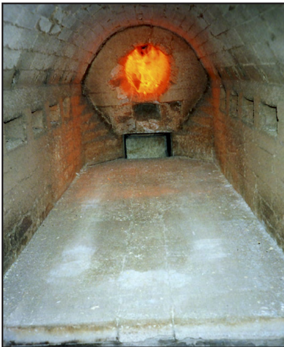
ALENE: Herfra er man alene. Møllendal krematorium før kremasjon.

bilde av hvordan man ser på seg selv og det å være menneske.