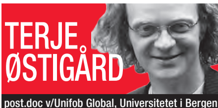
post.doc v/Unifob Global, Universitetet i Bergen

Hvorvidt historiene om Jesus i Etiopia har relevans for norske kristnes trosoppfatninger er derimot en annen sak og avhengig av tro.