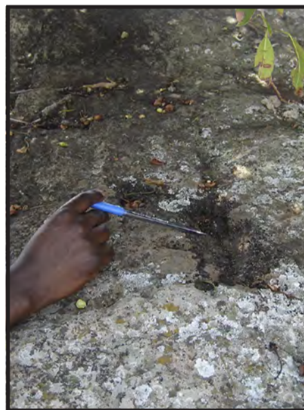
MARIA: En munk viser Jomfru Marias fotavtrykk i berget.

man tror. I den etiopiske ortodokse kirke er det en lang tradisjon for å konkretisere og materialisere hendelser og gjenstander i Bibelen til spesifikke steder.