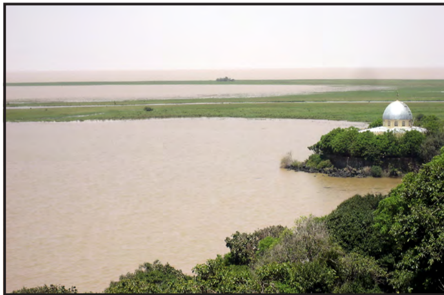
KLOSTER: Kirkos-klosteret ligger i Tana-innsjøen.

Hvor sannsynlig eller usannsynlig det er at Jesus var i Etiopia er avhengig av hva